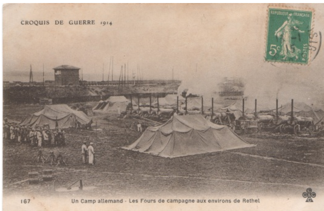
Pour nourrir la troupe.