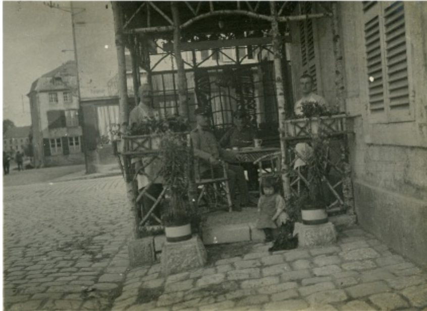
Une terrasse de café typiquement allemande à Mouzon.