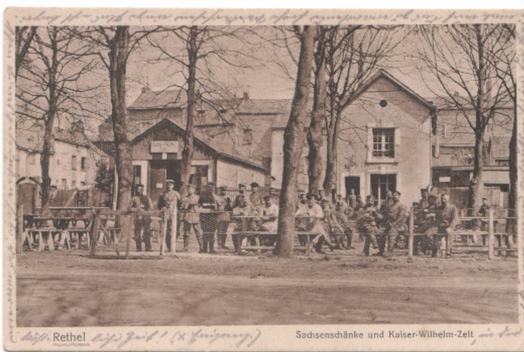
Café/restaurant allemand en plein air.