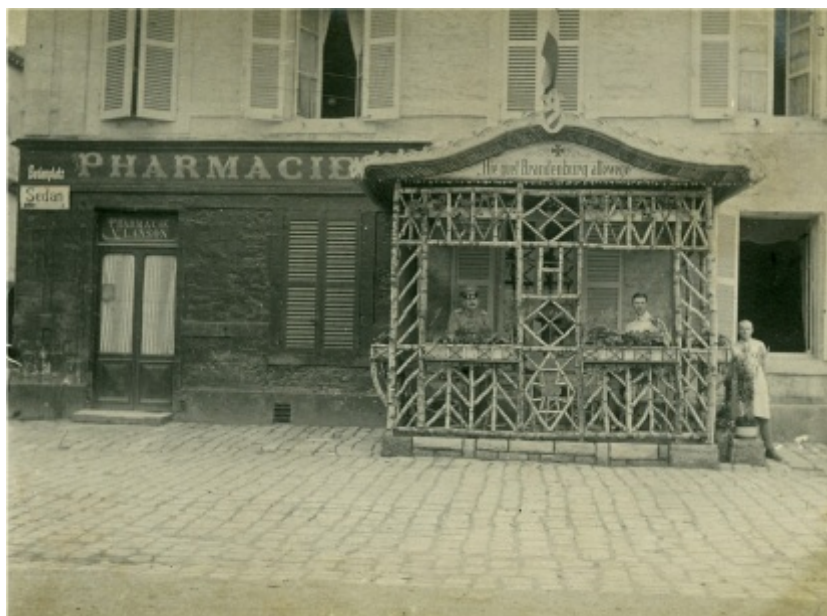
Une terrasse de café typiquement allemande à Mouzon.