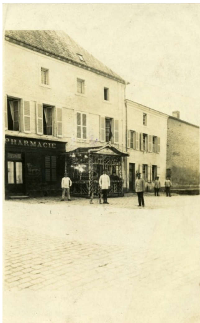
Une terrasse de café typiquement allemande à Mouzon.