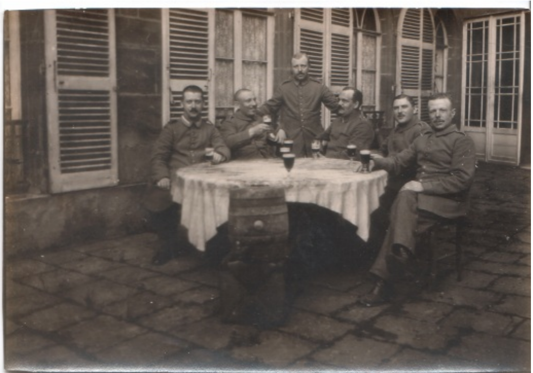
Officiers à Charleville.