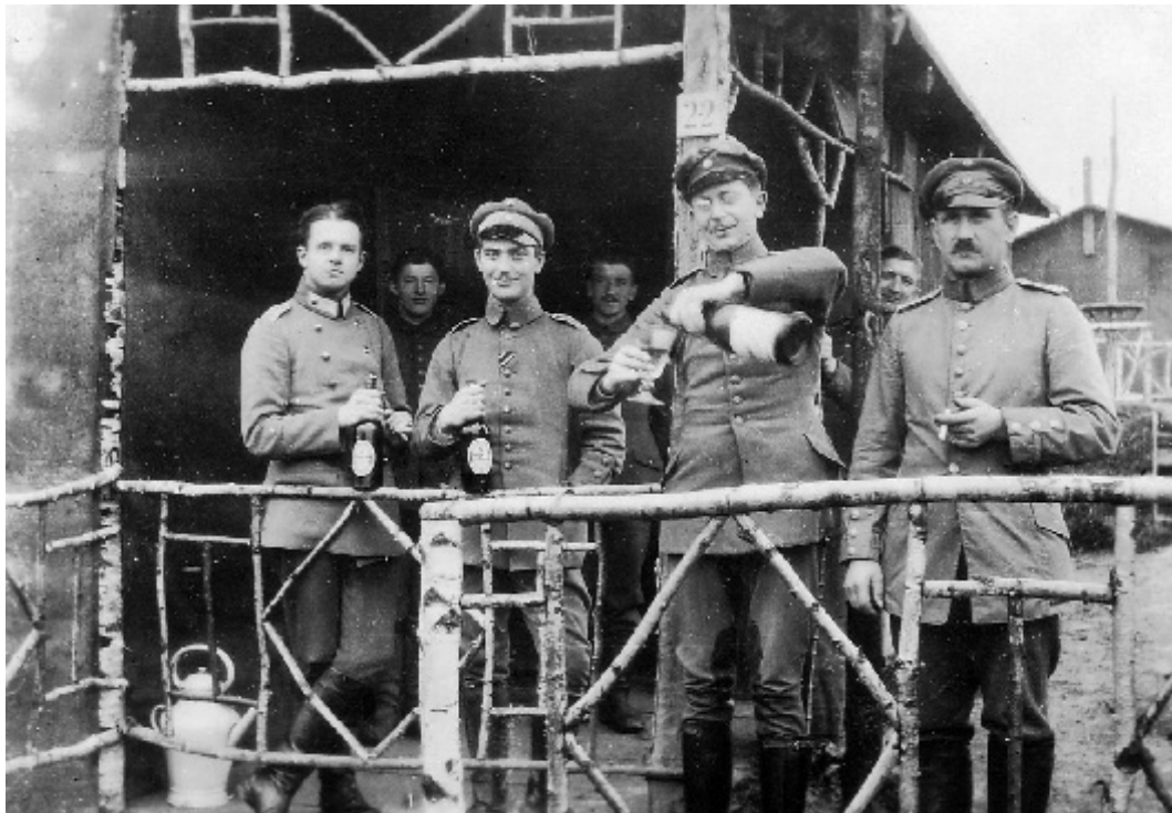
Officiers déjeunant au champagne !