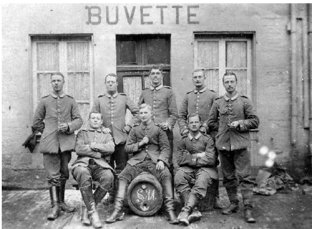
Buvette à Vouziers.