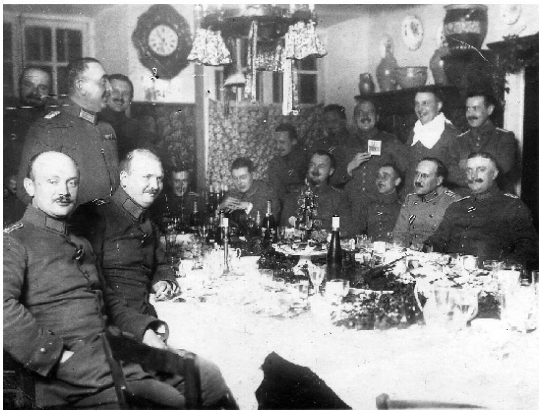
Repas de fête d'officiers, certainement de Noël ou de Nouvel An. Propriétaire oublié !