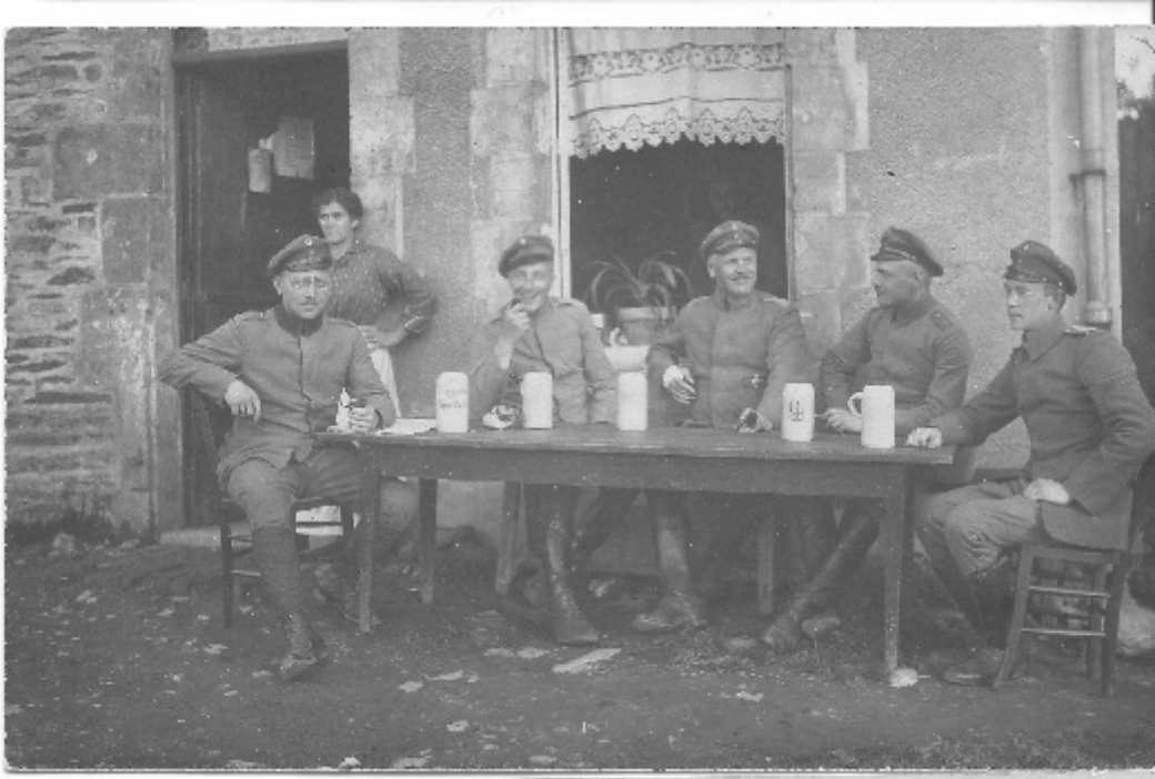
Médecins installés à Mellier-Fontaine.