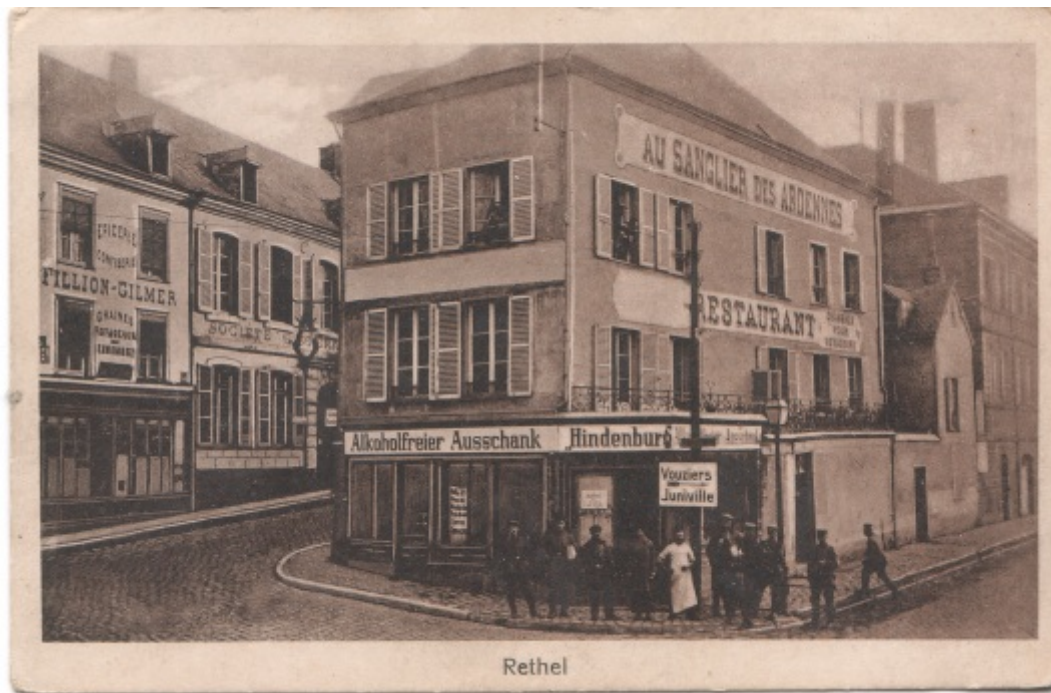
Pour lutter contre l'alcoolisme de la troupe, un magasin à Rethel qui vend des boissons non alcoolisées !