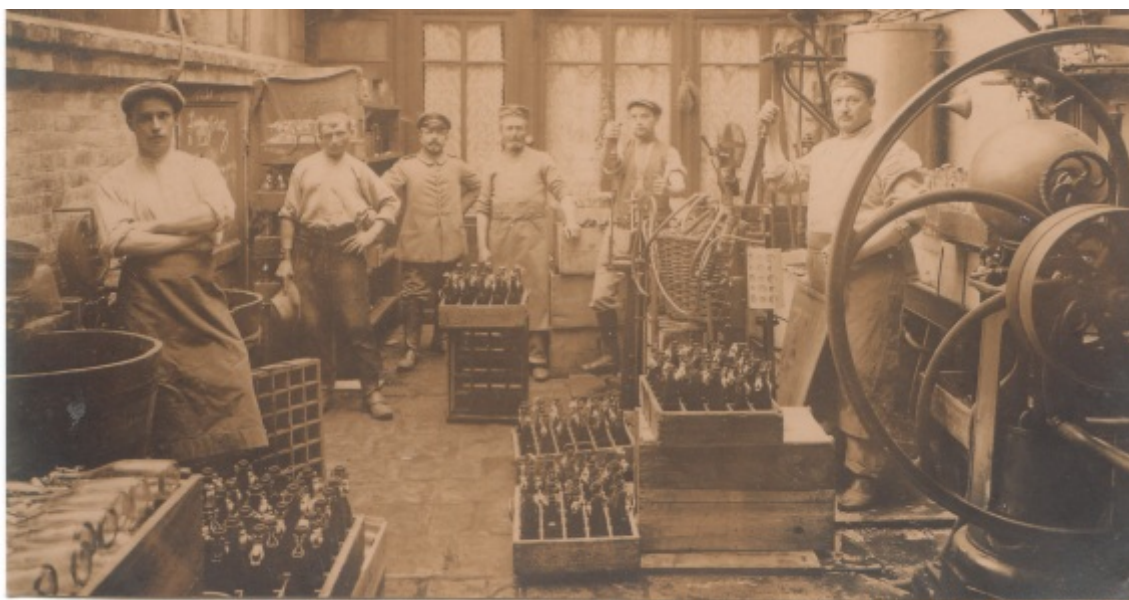
La brasserie de Balan et son personnel réquisitionné pour travailler avec des soldats allemands.