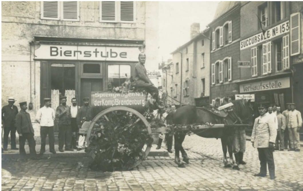
Mouzon devenu un quartier allemand.