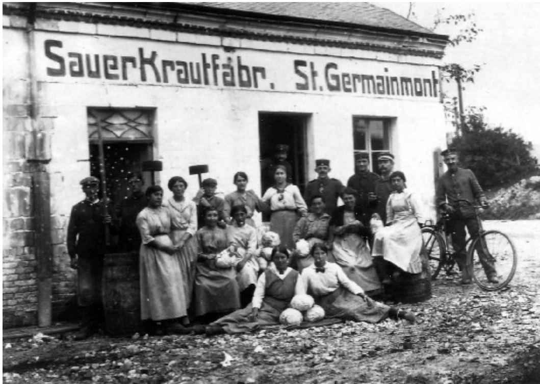
Plusieurs fabriques de choucroute ont été implantées dans les Ardennes. Propriétaire oublié !